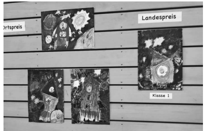
(2) Die preisgekrönten Kunstwerke der Schülerinnen und Schüler der Grundschule Alleshausen.