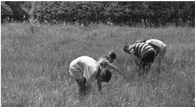
Die Erkundung des Lebensraums Wildblumenwiese gehört zum Ferienprogramm, das die Obst- und Gartenbauakademie Biberach (OGAB) vom 2. bis zum 6. September 2024 für Kinder im Alter von neun bis zwölf Jahren anbietet.

Für mehr Artenvielfalt im Landkreis Biberach: