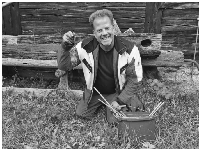
Alexander Ego gibt hilfreiche Tipps, wie Wühlmäuse im Garten bekämpft werden können.

Der Fachmann zeigt, woran man die Schädlinge erkennt und wie sie am besten mit der Bayerischen Drahtfalle zu fangen sind. Die Fallen sind immer noch die sicherste Art der Wühlmausbekämpfung, da sich der Erfolg unmittelbar überprüfen lässt. Zudem wird die Natur nicht mit Giftstoffen belastet, und auch die natürlichen Feinde der Wühlmäuse – Mauswiesel, Iltis, Raubvögel und Katzen – werden nicht ebenfalls vergiftet, wenn sie den Kadaver fressen. Treffpunkt für das Seminar ist an der Museumskasse. Die Kursgebühr beträgt 3,50 Euro.