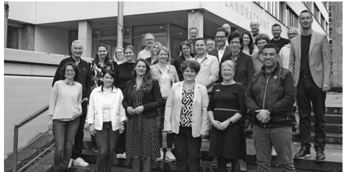
In der Kommunalen Gesundheitskonferenz entwickeln Verantwortungs- und Entscheidungsträgerinnen und –träger aus dem Gesundheitsbereich die Gesundheitsversorgung und Gesundheitsförderung im Landkreis Biberach weiter. Jetzt kamen sie zum Netzwerktreffen im Landratsamt zusammen.

Weitergehende Informationen zur Gesundheitskonferenz gibt es auf der Homepage des Kreisgesundheitsamts: www.biberach.de/gesundheitsförderung