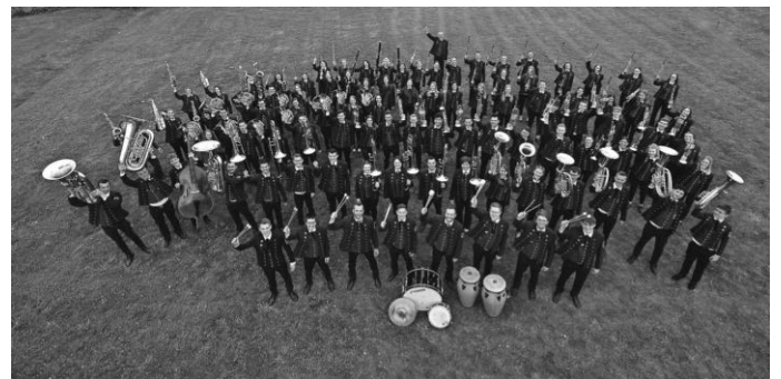
Die Kreisjugendmusikkapelle Biberach lädt zum Benefizkonzert ein.

Der Eintritt zum Benefizkonzert der Kreisjugendmusikkapelle Biberach ist frei. Spenden werden erbeten, die der Psychosozialen Krebsberatungsstelle Ulm, die auch Außensprechtag im Kreisgesundheitsamt Biberach abhält, zugutekommen.