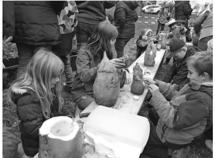
Die fleißigen Rübengeistschnitzer in Aktion