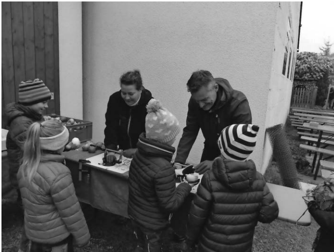
Die beiden Apfelschälmaschinen waren laufend in Betrieb