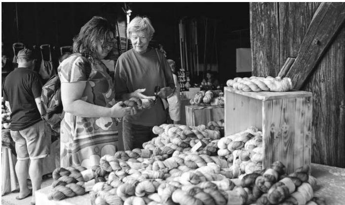
Am Sonntag 28. Juli können Besucherinnen und Besucher im Museumsdorf Kürnbach in die Welt von Wolle und Stoff eintauchen und sich die Kunst der Handarbeit näherbringen lassen.

Auch für das leibliche Wohl ist beim Kürnbacher Woll- und Stoffmarkt bestens gesorgt: Der Museumsbäcker holt köstliche Backwaren aus dem Ofen des historischen Backhäusles, die Kürnbacher Vesperstube mit ihrem sonnigen Biergarten lockt mit schwäbischen Köstlichkeiten und verschiedene Imbissstände bieten herzhaft und süße Leckereien.