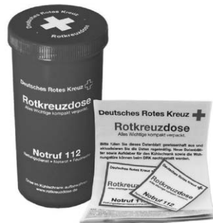
Rotkreuzdose Alles Wichtige kompakt verpackt.

Bei akuten häuslichen Notfällen kann ein Datenblatt in der Rotkreuzdose lebensrettend sein. Die Rotkreuzdose ist inkl. Datenblatt für 2,52 € in der Geschäftsstelle des DRK Biberach erhältlich. Auf dem Datenblatt werden Vorerkrankungen, Medikamente, Hausarzt, Kontaktpersonen usw. notiert, so dass diese Daten im Notfall rasch vorliegen. Die Dose wird im Kühlschrank aufbewahrt, weil man den Kühl-